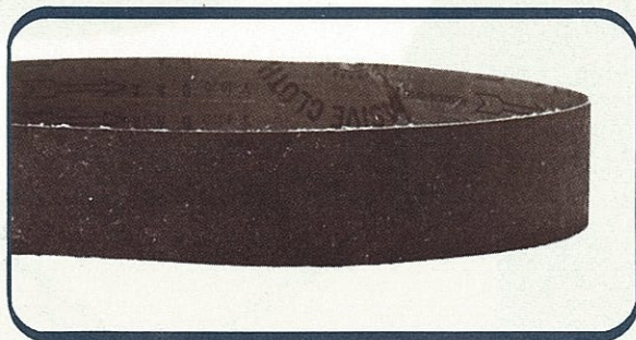
● オーイテ・サンダックス塗布 ●